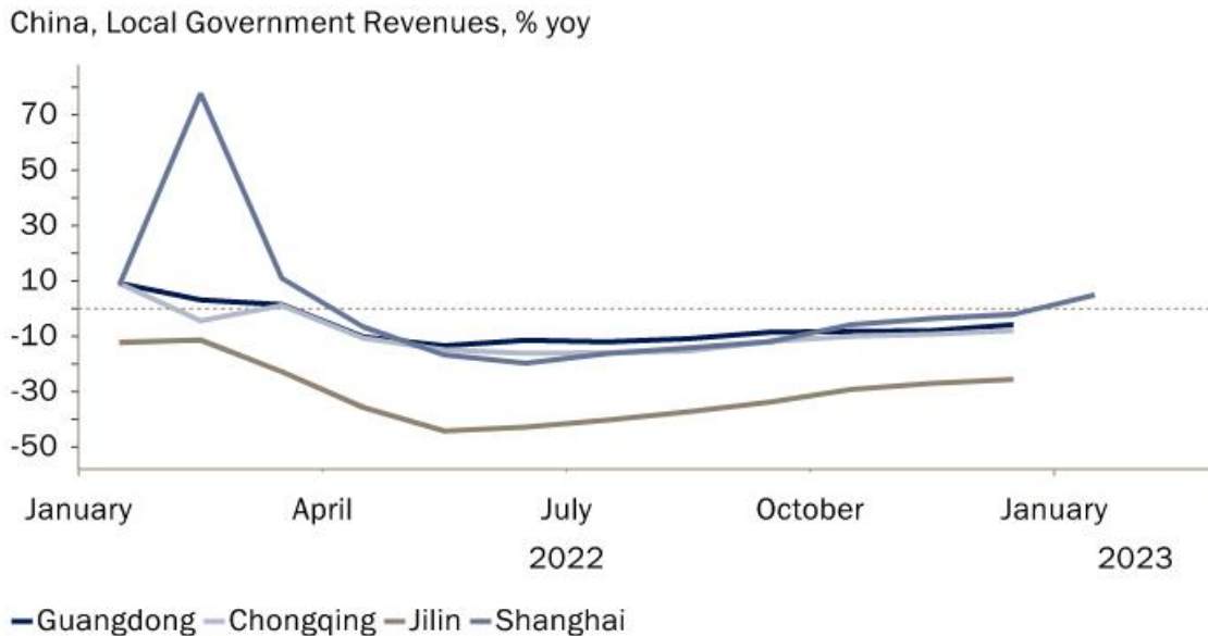
Gráfico 2: Las administraciones locales tuvieron dificultades para funcionar el año pasado