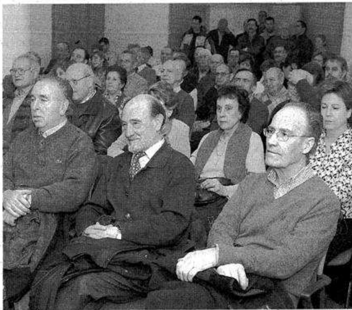
El público volvió a llenar el Club de Prensa del Diario de León